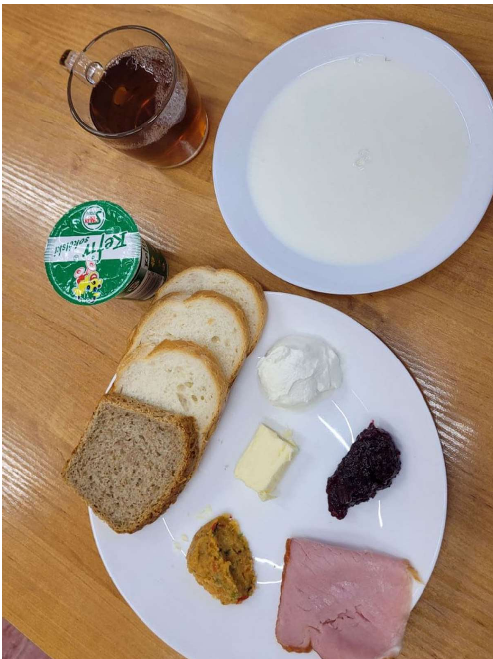
Śniadanie: dieta podstawowa