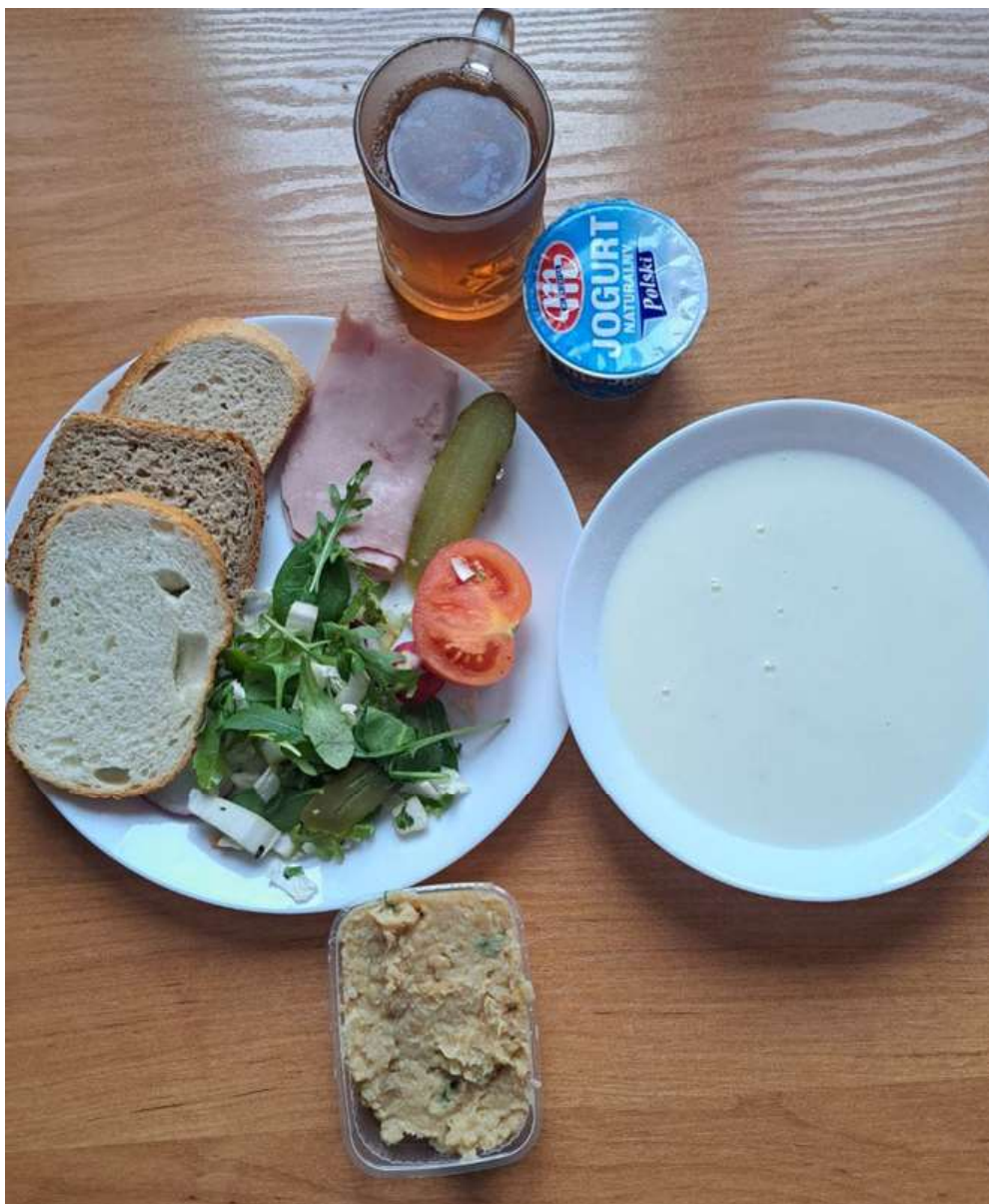
Śniadanie: dieta podstawowa