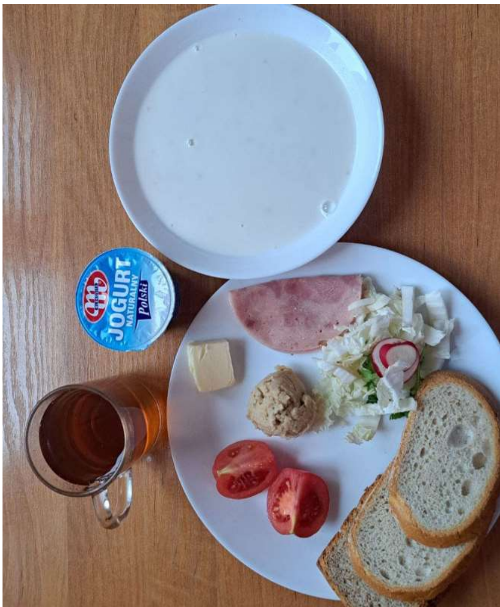
Śniadanie: dieta podstawowa