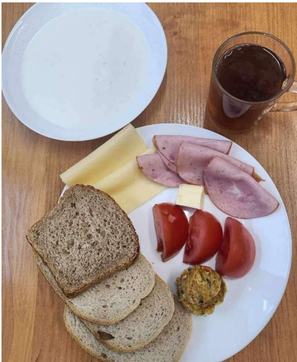
Śniadanie: dieta podstawowa