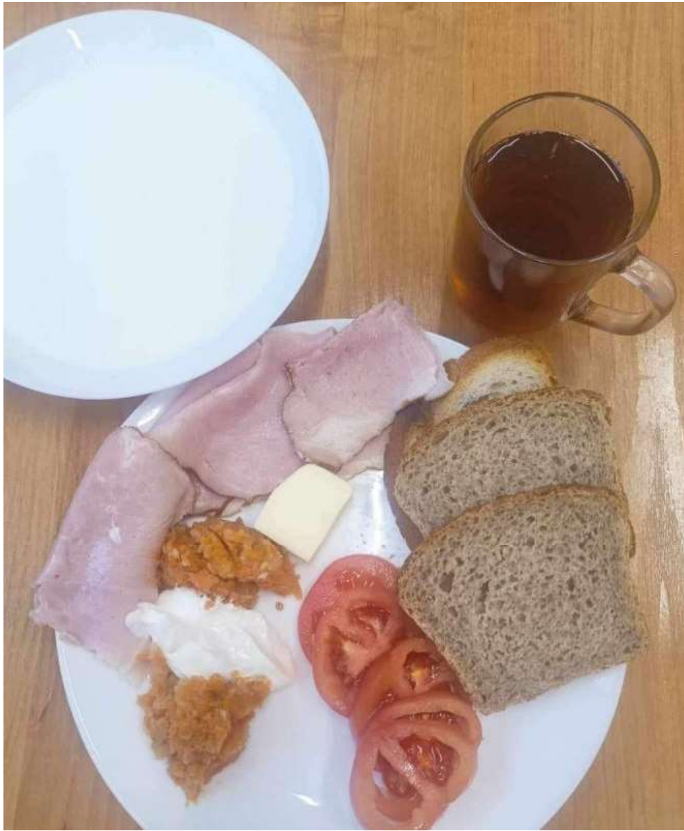
Śniadanie: dieta podstawowa