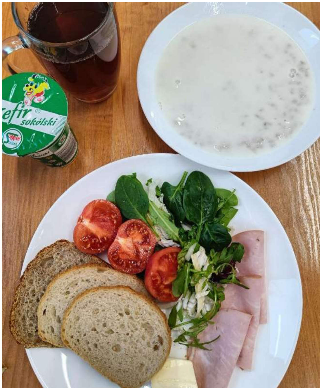
Śniadanie: dieta podstawowa