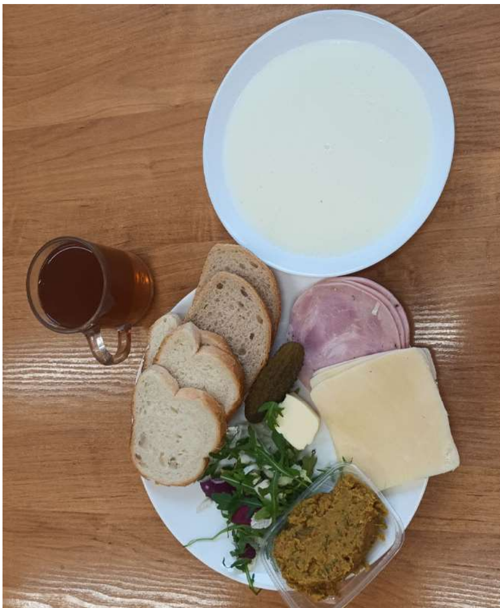
Śniadanie: dieta podstawowa