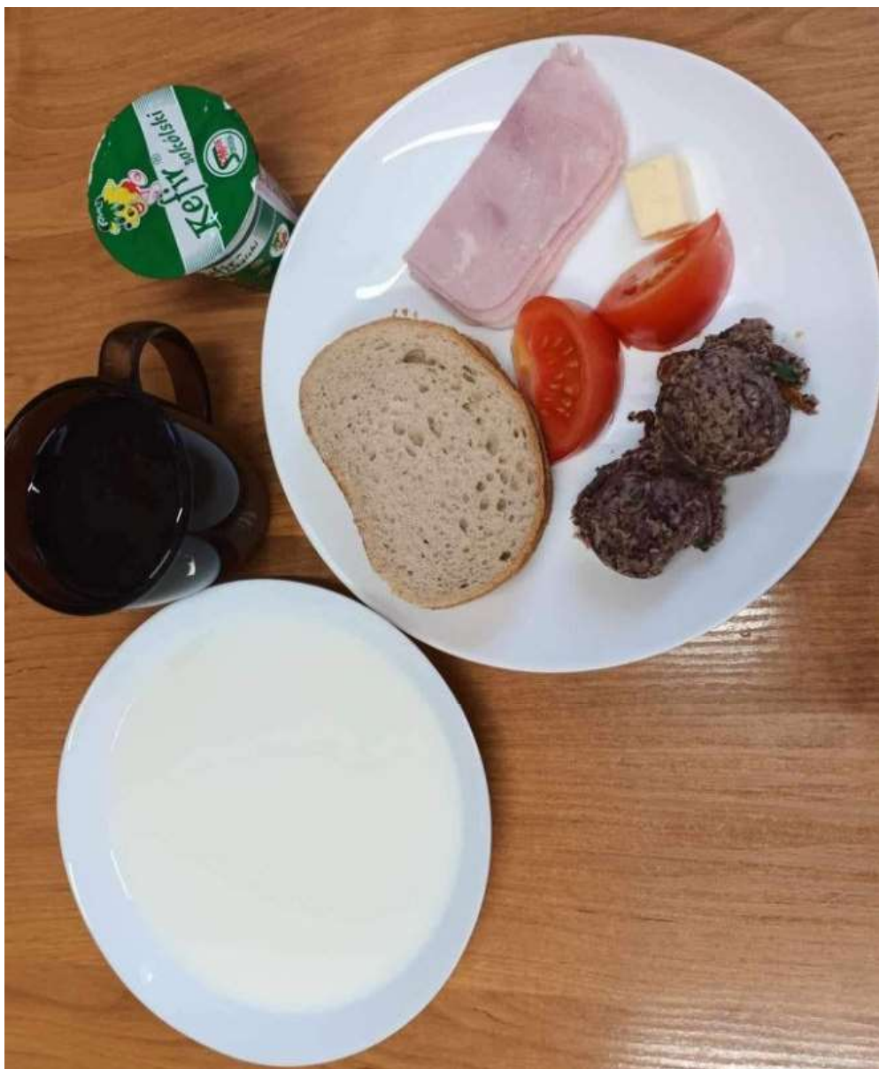
Śniadanie: dieta podstawowa