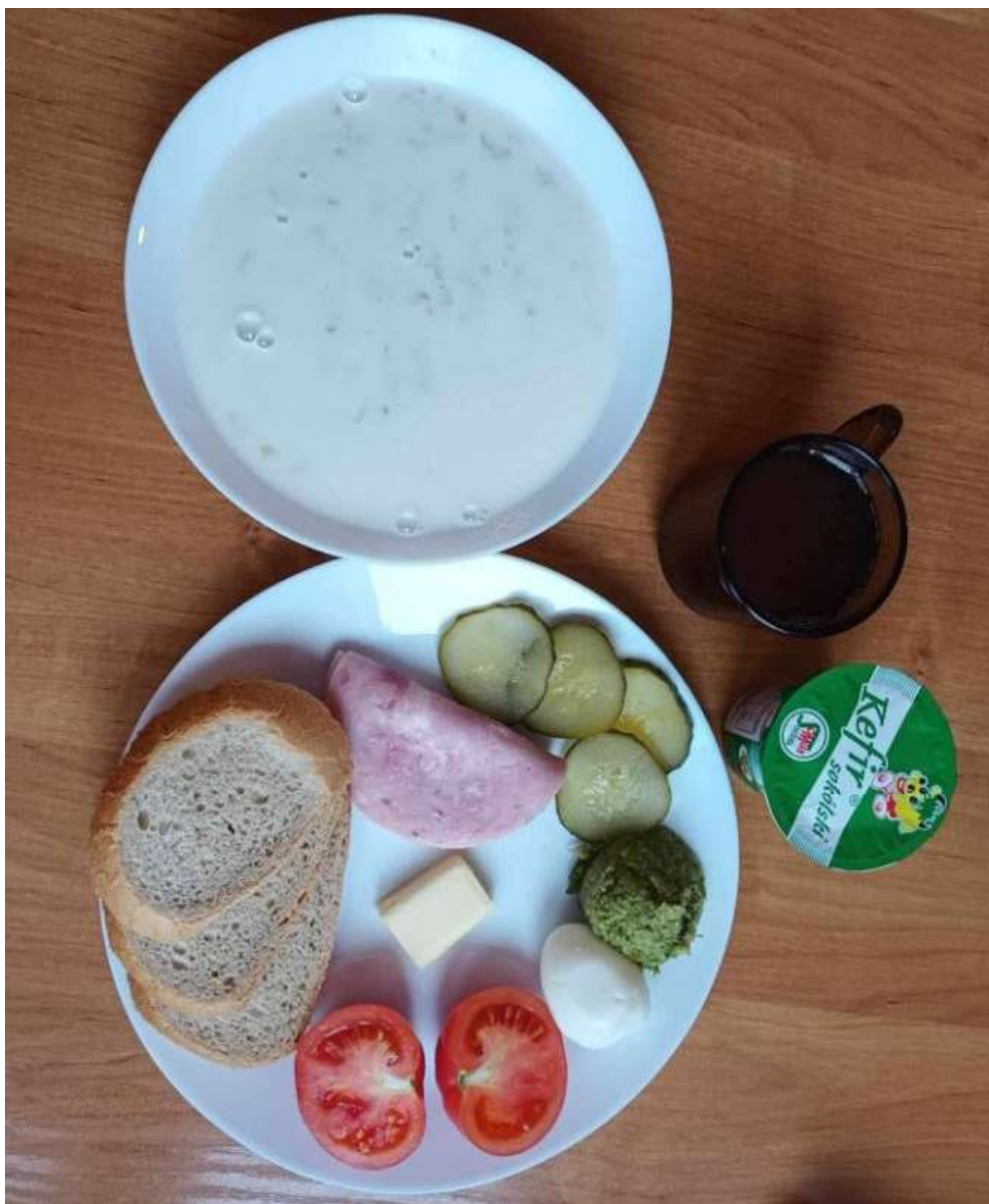
Śniadanie: dieta podstawowa