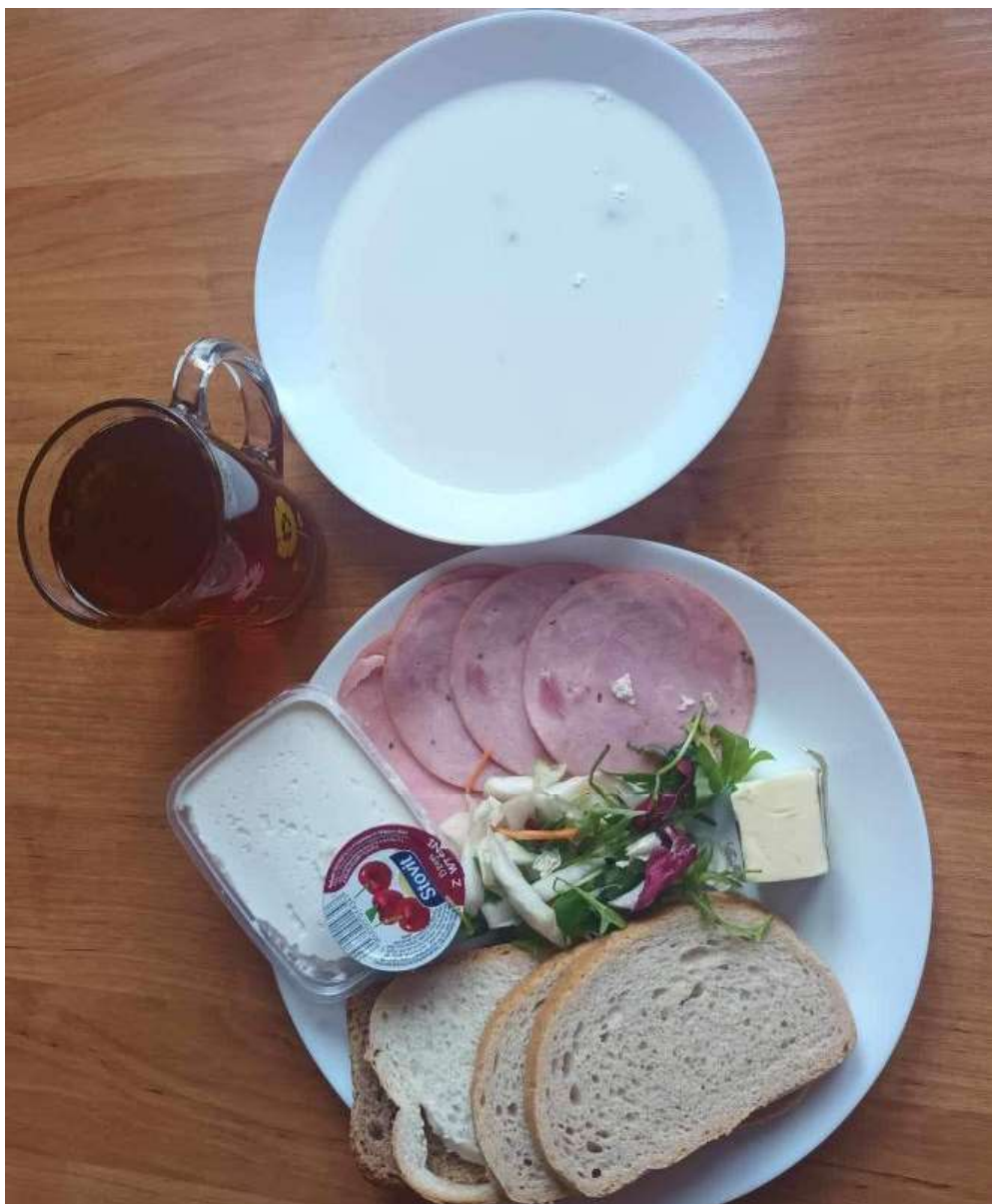
Śniadanie: dieta podstawowa