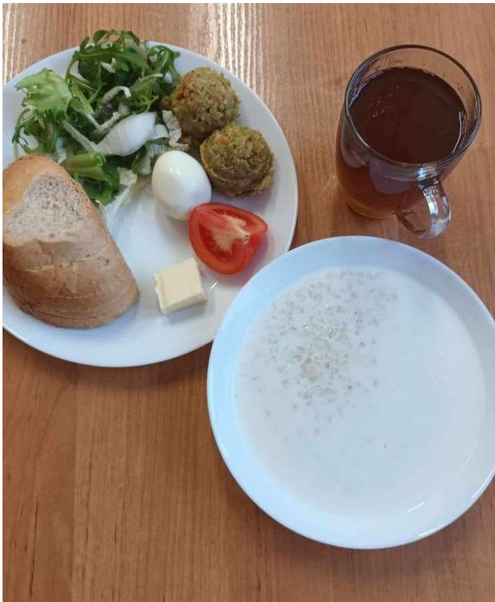
Śniadanie: dieta podstawowa