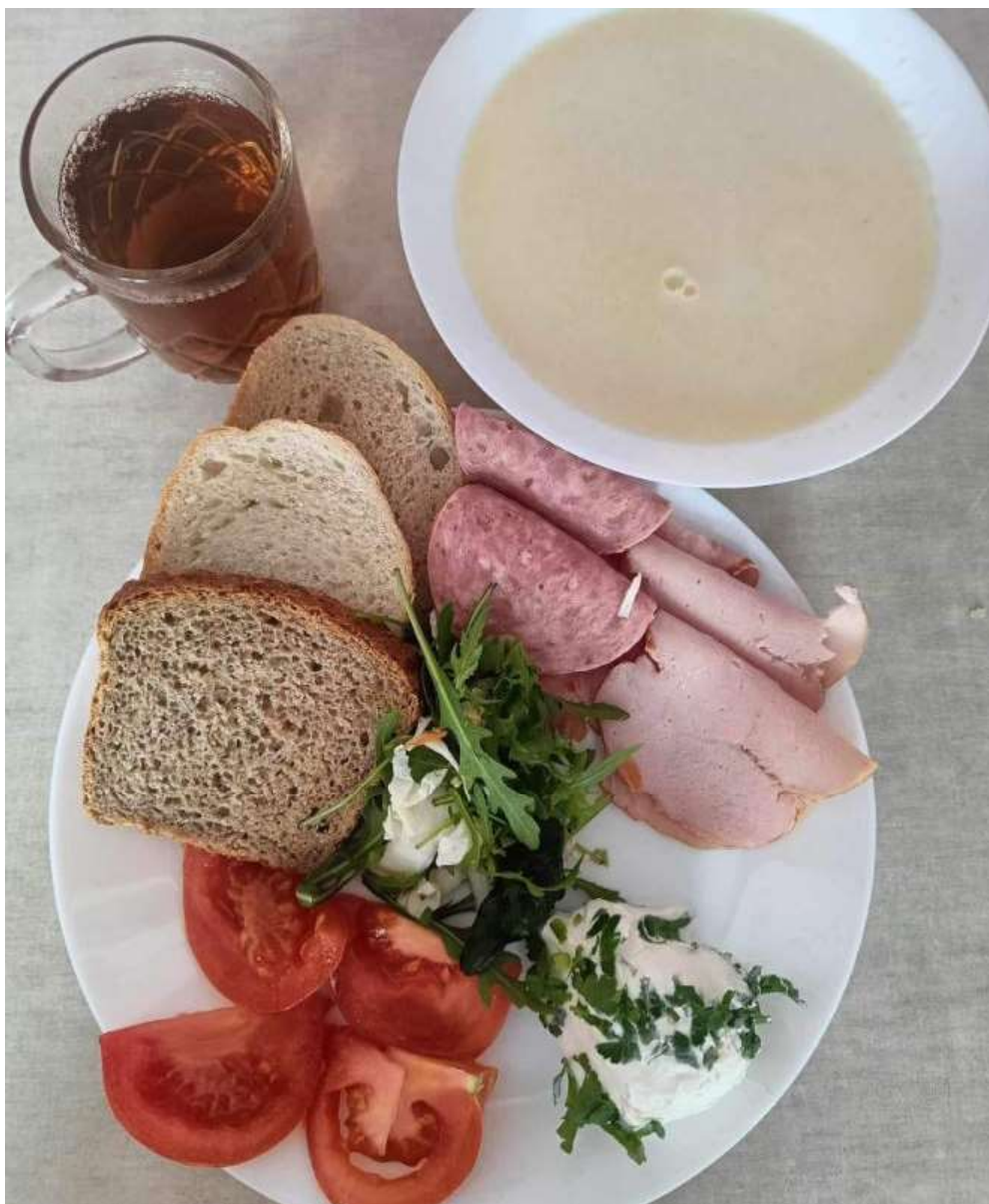
Śniadanie: dieta podstawowa