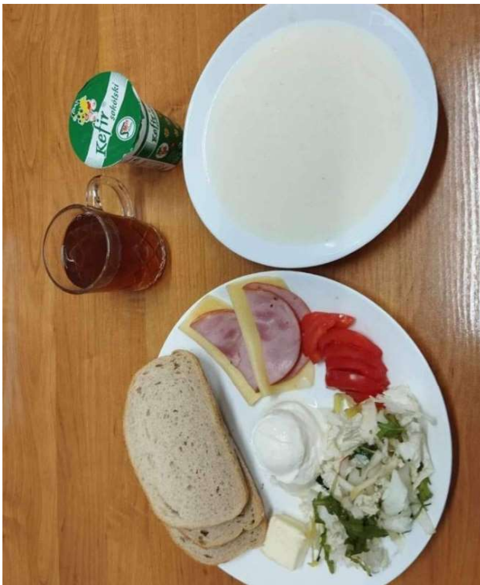
Śniadanie: dieta podstawowa