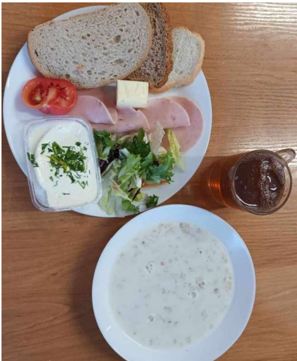
Śniadanie: dieta podstawowa