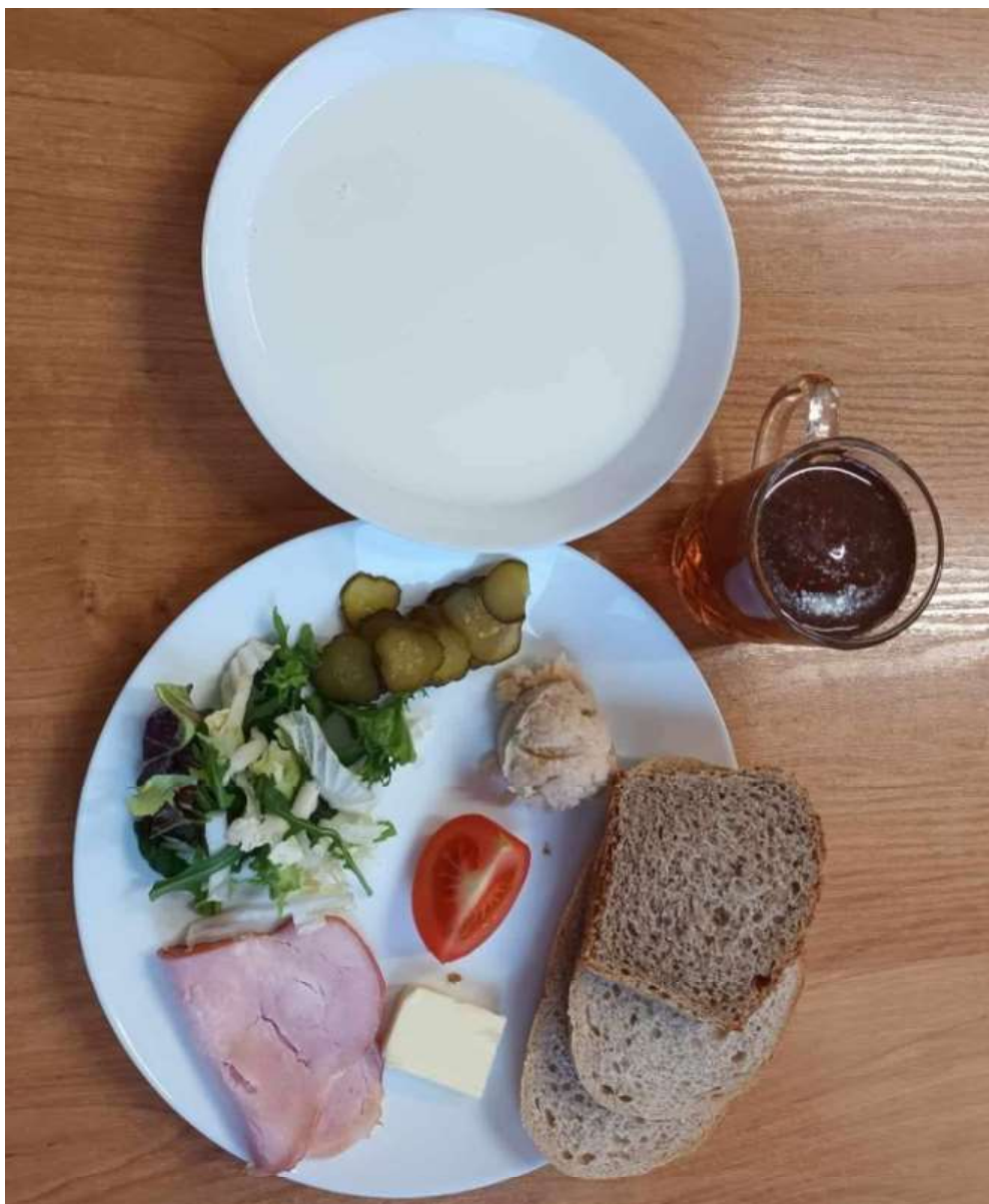
Śniadanie: dieta podstawowa