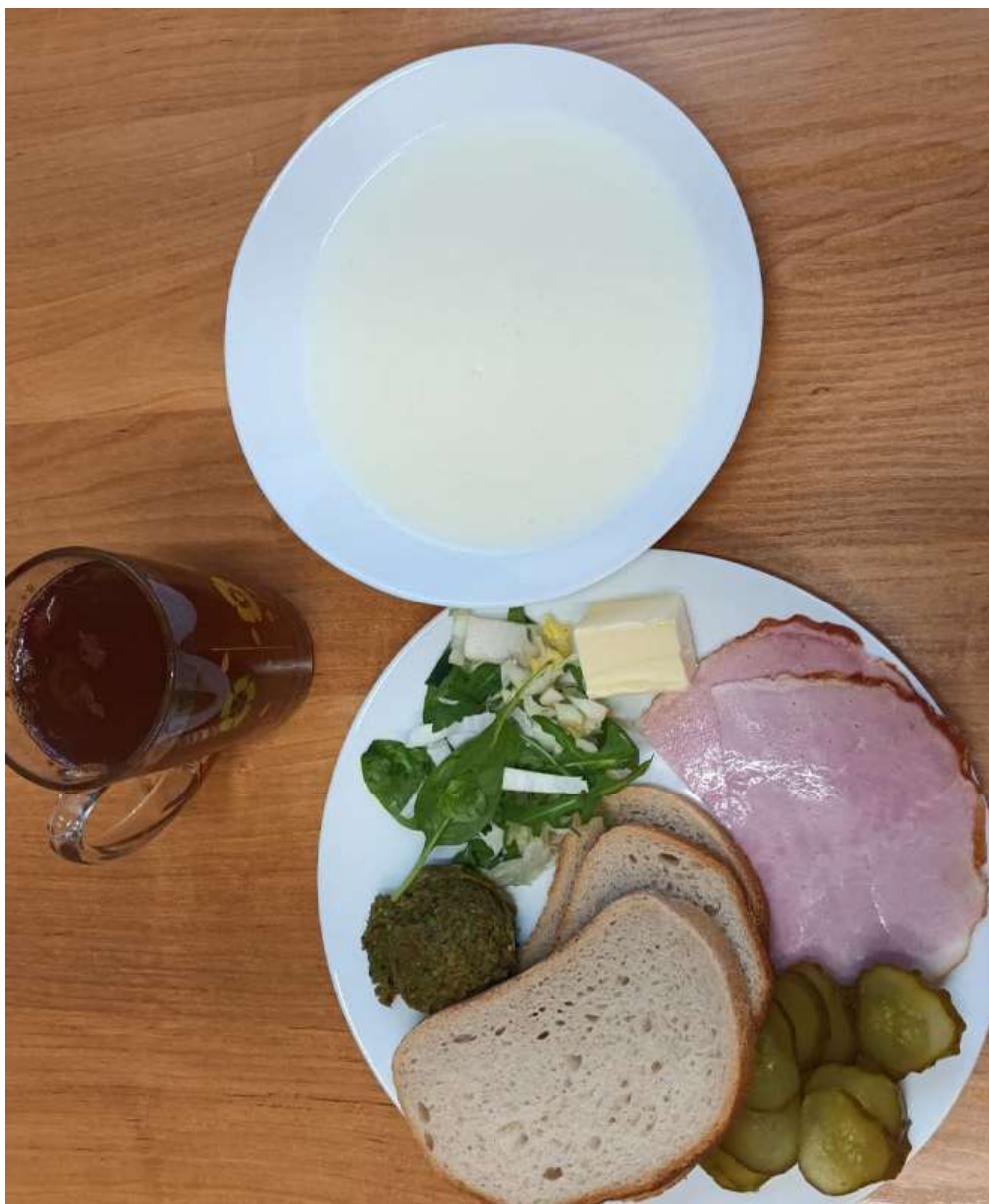
Śniadanie: dieta podstawowa