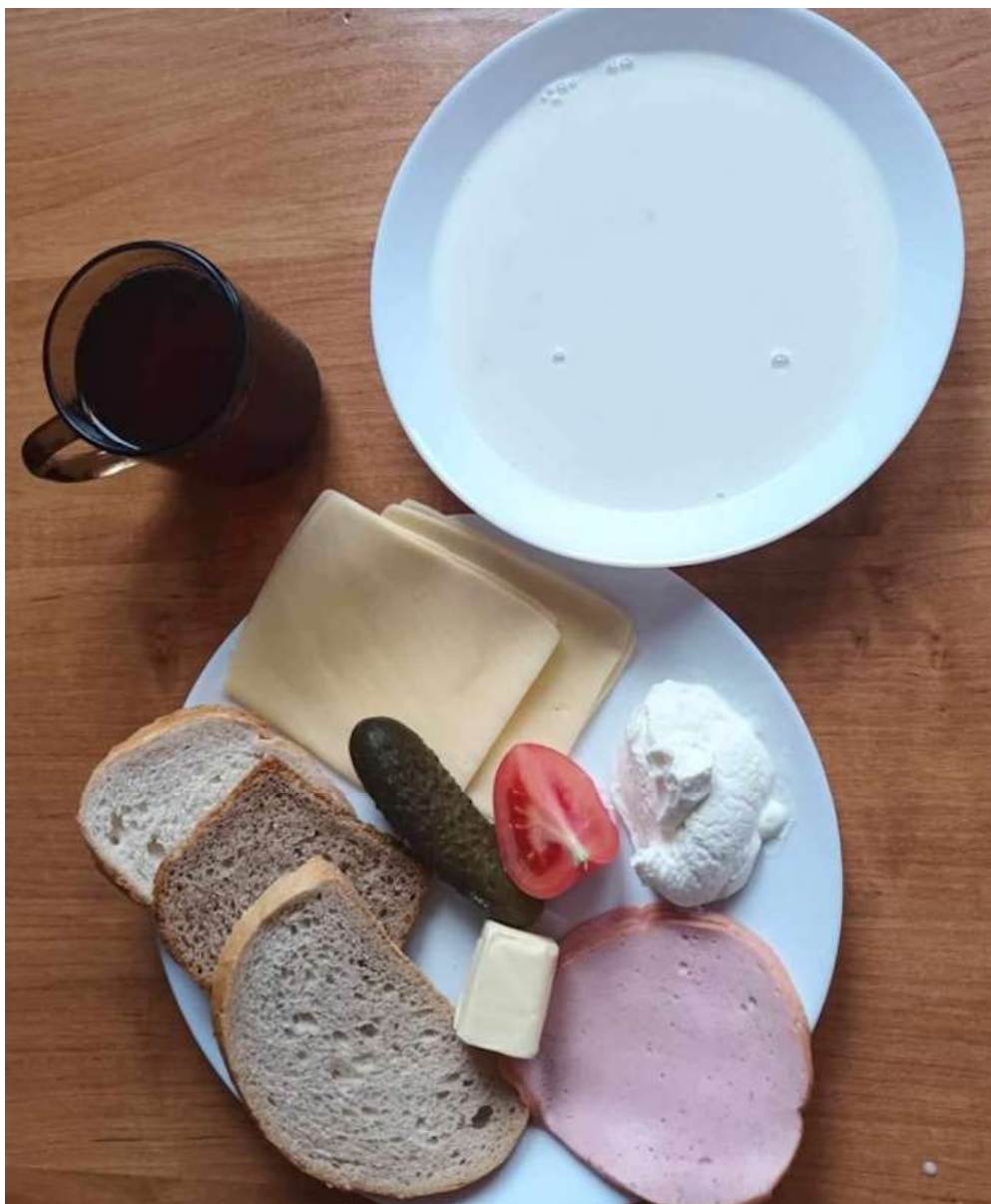
Śniadanie: dieta podstawowa