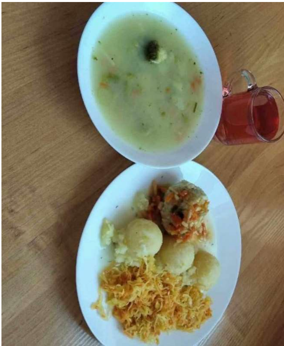
Obiad: dieta podstawowa