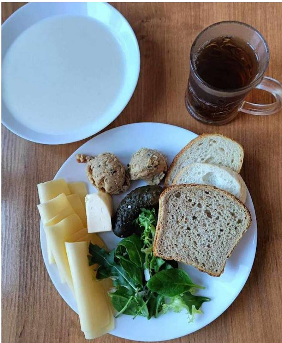
Śniadanie: dieta podstawowa