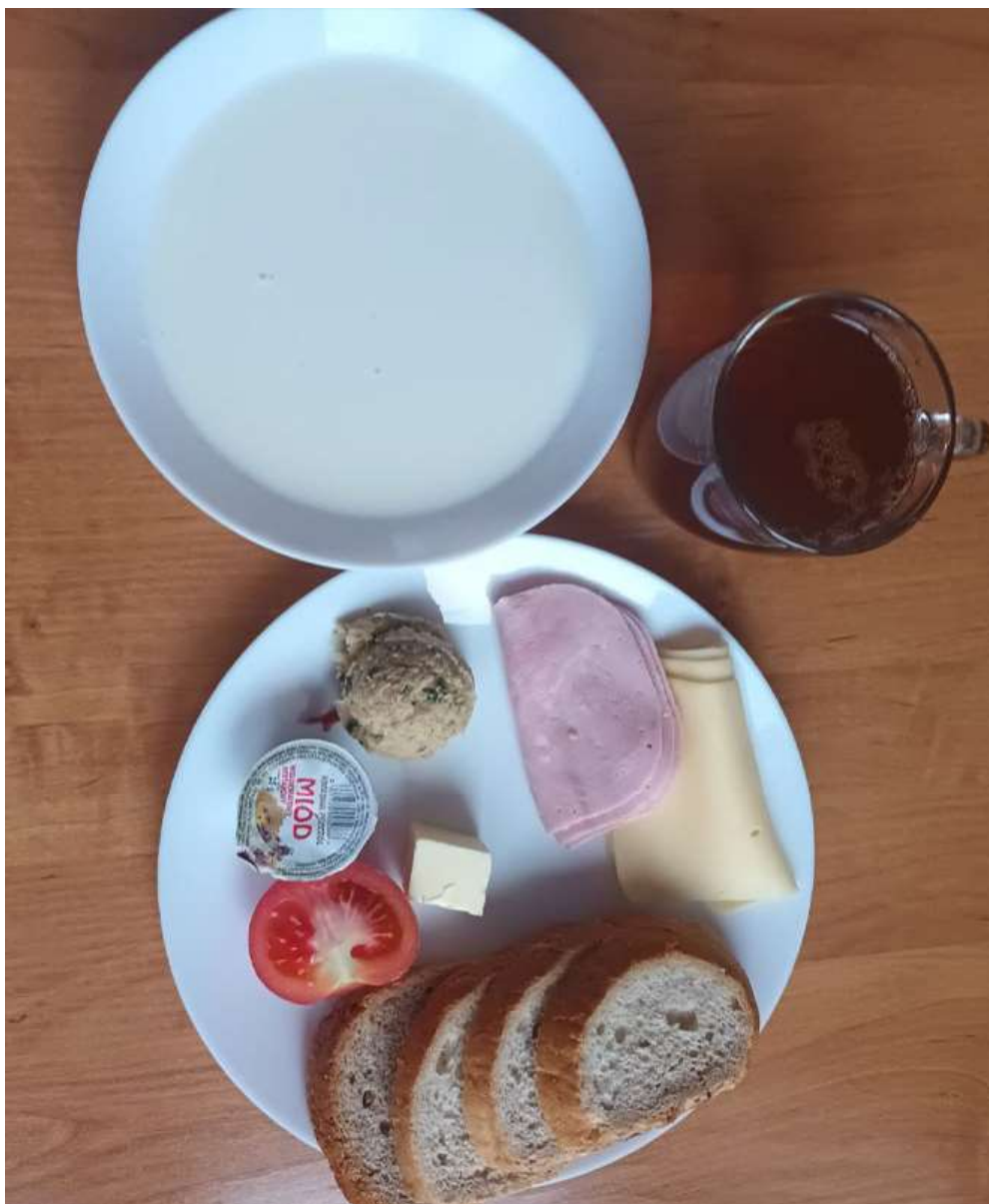
Śniadanie: dieta podstawowa