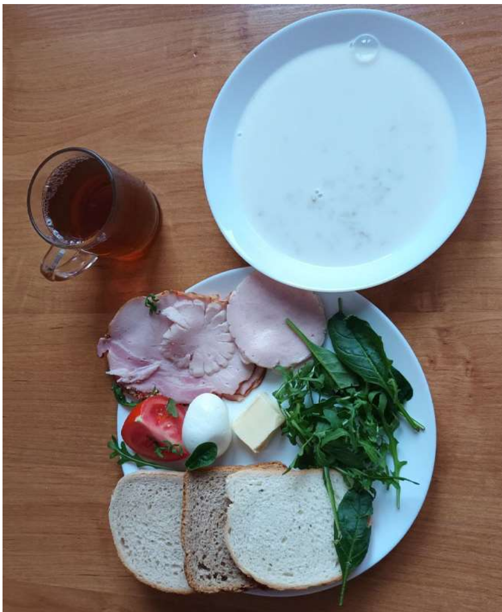
Śniadanie: dieta podstawowa